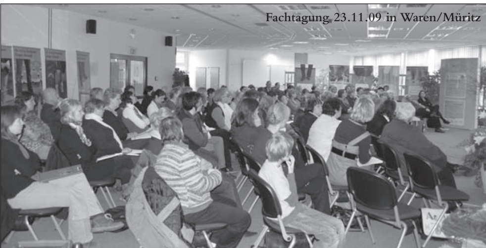
Fachtagung 23.11.09 in Waren/Müritz

Neben den Schutz- und Hilfeeinrichtungen für betroffene Frauen und deren Kinder setzt die Interventionskette gegen Gewalt in Mecklenburg-Vorpommern daher auch auf täterbezogene Intervention. Deshalb stehen Beratungs- und Hilfsangebote für gewalttätige Männer bereit, um auch die Verursacher der Gewalt zu erreichen und ihr Verhalten nachhaltig zu verändern. Denn effektive Täterarbeit bedeutet zugleich aktiven Opferschutz für die Zukunft. Nur wenn die Täter ihr Verhalten ändern, kann der Gewaltkreislauf endgültig durchbrochen werden.