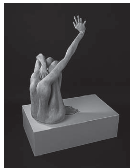
„Sie haben ihre Engel getötet“ Skulptur 2014, Gips.

fentlichkeit interessiert mich zu diesem Zeitpunkt nicht. Vor genau einem Jahr, am Internationalen Tag zur Beseitigung der Gewalt gegen Frauen, ist das Thema in mein Leben gekommen. Ich bin auf Abgründe menschlichen Fehlverhaltens gestoßen, die durchaus nicht weit genug in unser Bewusstsein dringen. Sie geschehen am Rande, scheinen mit einem Tabu behaftet zu sein und müssten doch mit einem Fluch behangen sein. Weltweite Konflikte mit Kriegen und Massenmorden überlagern unsere Wahrnehmung für das, was inmitten unserer satten Gegenwart geschieht. Um wie vieles mehr noch in Ländern, in denen Frauen kaum Rechte haben. Diese Skulptur musste entstehen und ich bin erst zur Ruhe gekom-