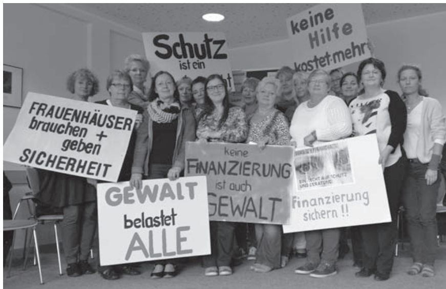
Landesarbeitsgemeinschaft der Frauenhäuser und Beratungsstellen für Betroffene von häuslicher Gewalt M-V Weitere Infos unter www.gewaltfrei-zuhause-in-mv.de

Alle Kommentare sind zu finden unter: www.openpetition.de/petition/kommentare/opferschutz-als-pflichtaufgabe