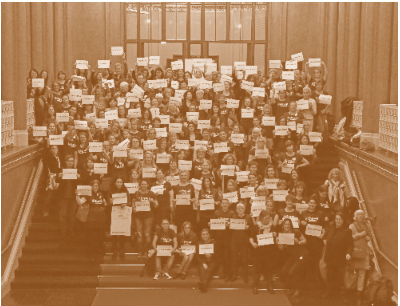
Teilnehmende der WAVE-Konferenz im Foyer des Roten Rathauses in Berlin