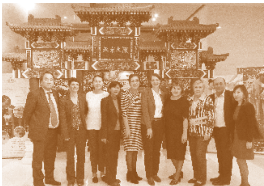
Teilnehmer*innen des Runden Tisches „Soziale Partnerschaften im Interesse der Frauen und Kinder“ am 7. Oktober im Foyer des Hotel Beijing Palace Soluxe in Astana

Am Ende der Sitzung findet eine Preisverleihung anlässlich des 25.