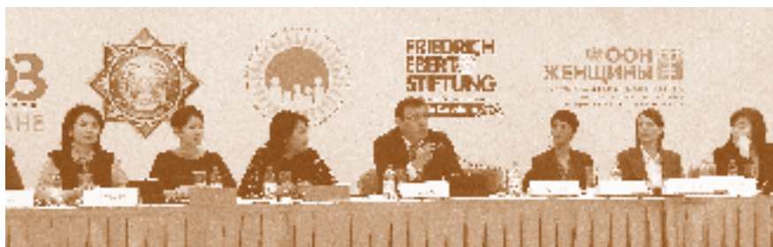
Das Podium beim Nationalen Ausschuss für Frauen und Familienpolitik beim Präsidenten der Republik Kasachstan