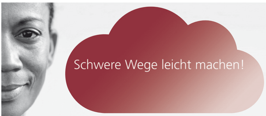
Kampagne der autonomen und verbandlichen Frauenhäuser www.schwerewegeleichtmachen.de

Die gemeinsame Pressemitteilung des bff, der Zentralen Informationsstelle Autonomer Frauenhäuser (ZIF) und der Frauenhauskoordinierung (FHK) verweist auf die Tötungen an Frauen durch ihre (Ehe)Partner oder ehemaligen (Ehe) Partner. „Nahezu jede zweite (40,8%) der Frauen, die im Jahr 2012 getötet wurden, wurde durch den eigenen (Ehe) Partner oder ehemaligen (Ehe)Partner getötet.“ Für das Jahr 2012 weist die Polizeiliche Kriminalstatistik 106 Tötungen an Frauen durch ihre (Ehe)Partner oder ehemaligen (Ehe)Partner aus.