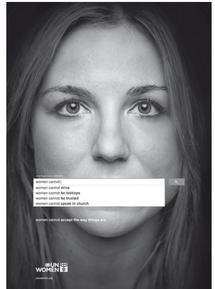
Plakat von UN Women

Am Internationalen Tag zur Beendigung der Gewalt gegen Frauen setzen sich die Vereinten Nationen daher auch für die Gleichstellung von Frauen ein – damit die Suchvorschläge der Internet-Suchmaschinen vielleicht schon bald den Satz „Women need to be equal“ („Frauen müssen gleichberechtigt sein“) anzeigt.