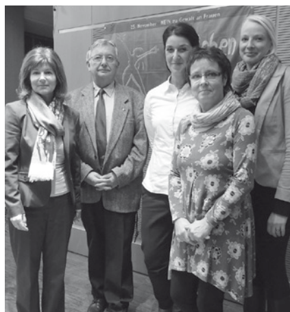
Die Veranstalter_innen und Referentinnen des Fachtages in Bad Doberan

Um die Öffentlichkeit zu informieren, zu sensibilisieren und den Opfern Mut machen, sich Hilfe zu holen, werden jedes Jahr um den 25. November, dem internationalen Tag „Nein zu Gewalt an Frauen“, bundes- und landesweite Aktionen und Veranstaltungen durchgeführt. In diesem Jahr wurde in Mecklenburg-Vorpommern auch das Thema Frauenhandel und Gewalt an Frauen im Migrationsprozess in die öffentliche Debatte geholt. Wir berichten in der CO-RAktuell über drei Veranstaltungen dazu: aus Bad Doberan, Wismar und Rostock.