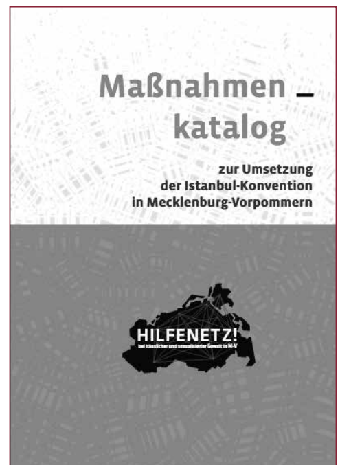
Gestaltung: Marion Hornung

Uns Praktiker*innen aus dem Hilfenetz wird eine gewisse Ungeduld und fordernde Haltung zugeschrieben – das trifft zu. Tatsächlich denken wir, jede in ihrer Würde und Integrität verletzte Frau ist eine zu viel. Die Istanbul-Konvention schafft endlich Voraussetzungen dafür, nicht länger in der „Feuerwehrfunktion“ zu verharren und ausschließlich in die Bewältigung der massiven Folgen von Gewalt zu investieren, sondern in deren Verhinderung. Wir sind ungeduldig und dennoch realistisch genug zu wissen, dass die Umsetzung der Istanbul-Konvention ein langfristiger Prozess wird. Gerade deshalb möchten wir ihn JETZT gemeinsam mit Ihnen beginnen.